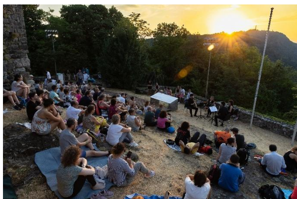
Hotel Villa Flori